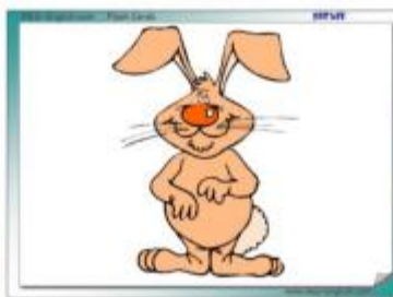
THE EASTER BUNNY