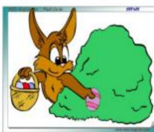
HIDING EASTER EGGS