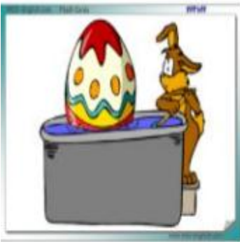
DYING EASTER EGGS

“I build my life project, from creative thinking and community values”