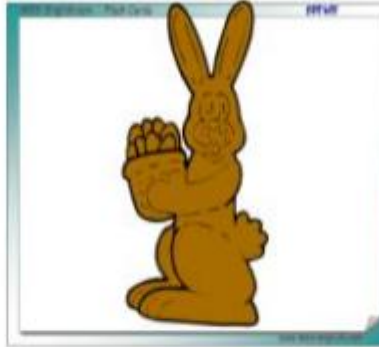
A CHOCOLATE BUNNY