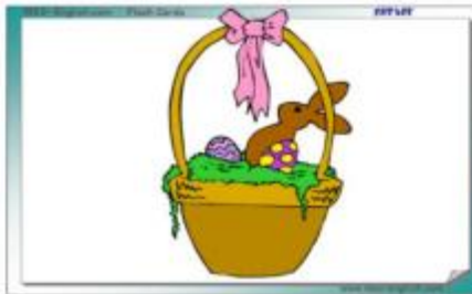
AN EASTER BASKET