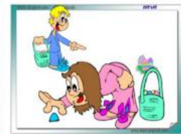
AN EASTER EGG HUNT